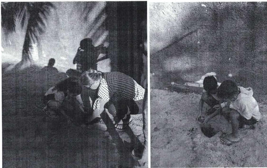
Plantio de mudas de árvores nas proximidades da escola.