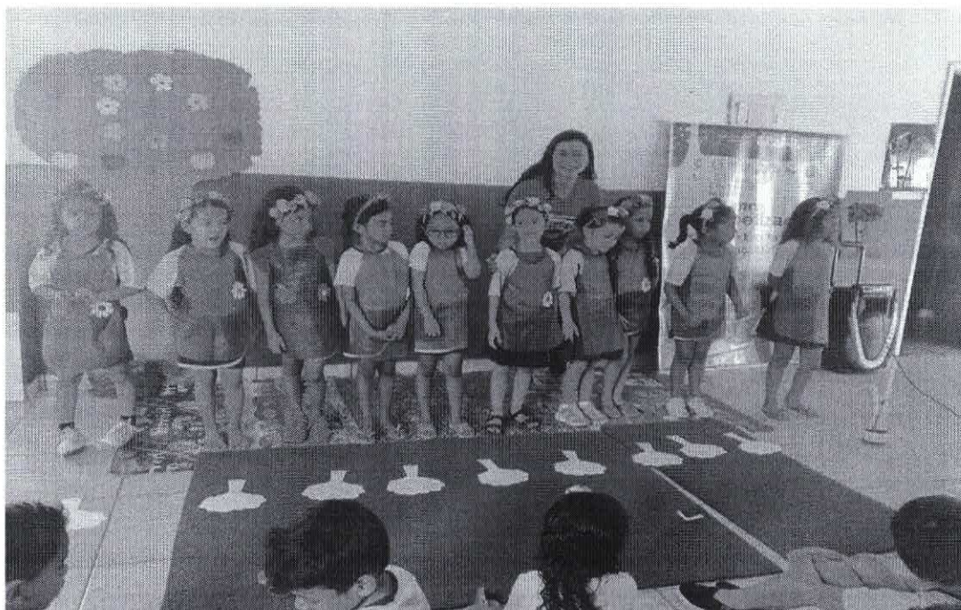
Apresentação da Educação Infantil com música – Importância da água