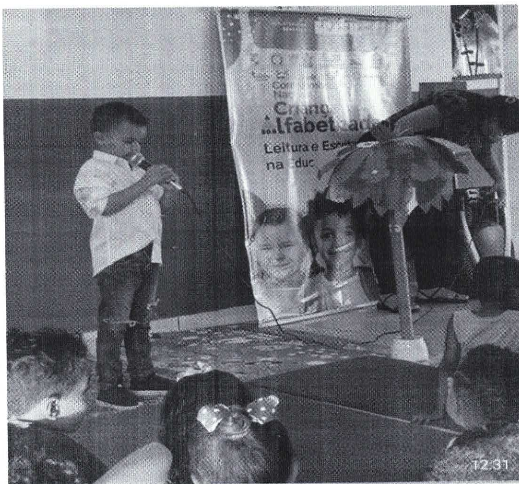
Mensagem de reflexão sobre a importância das árvores para a vida humana