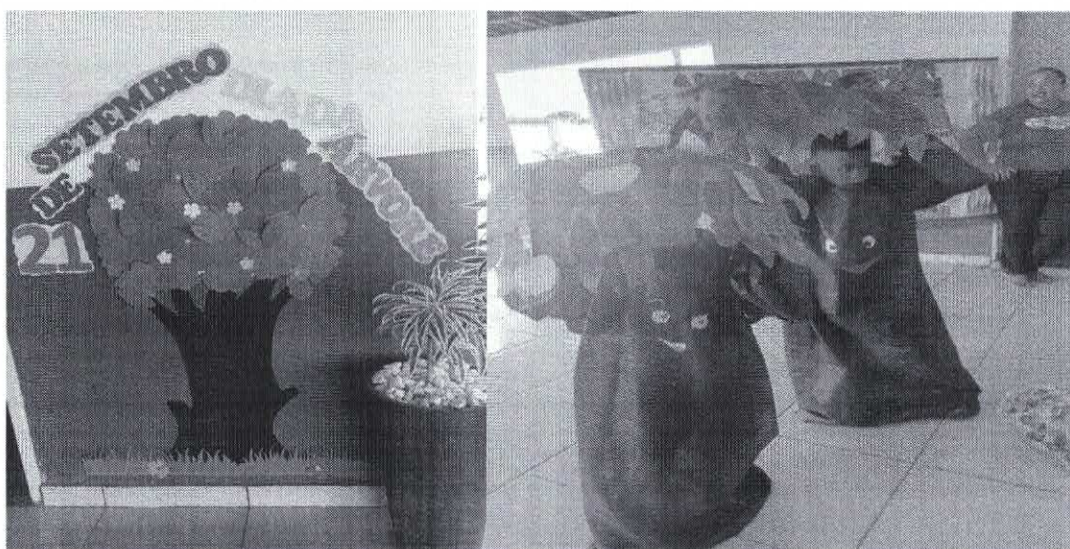
Apresentação de produções coletivas representando árvores, florestas e jardins pelos professores e estudantes.