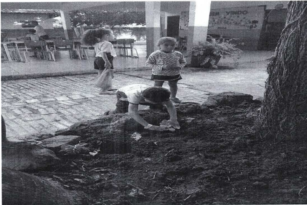
Realização de plantio de mudas pelos estudantes do Ensino Fundamental