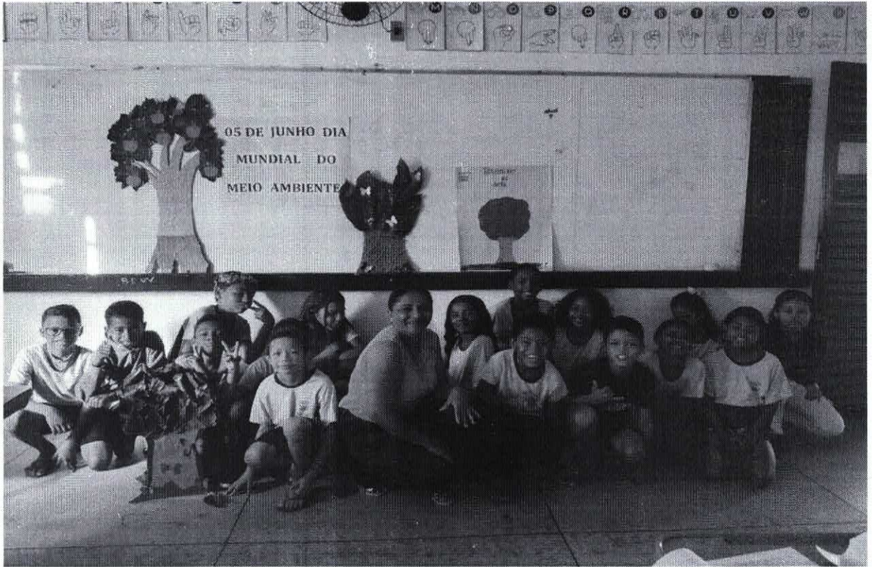
Atividade de reciclagem – Turma do 5º ano