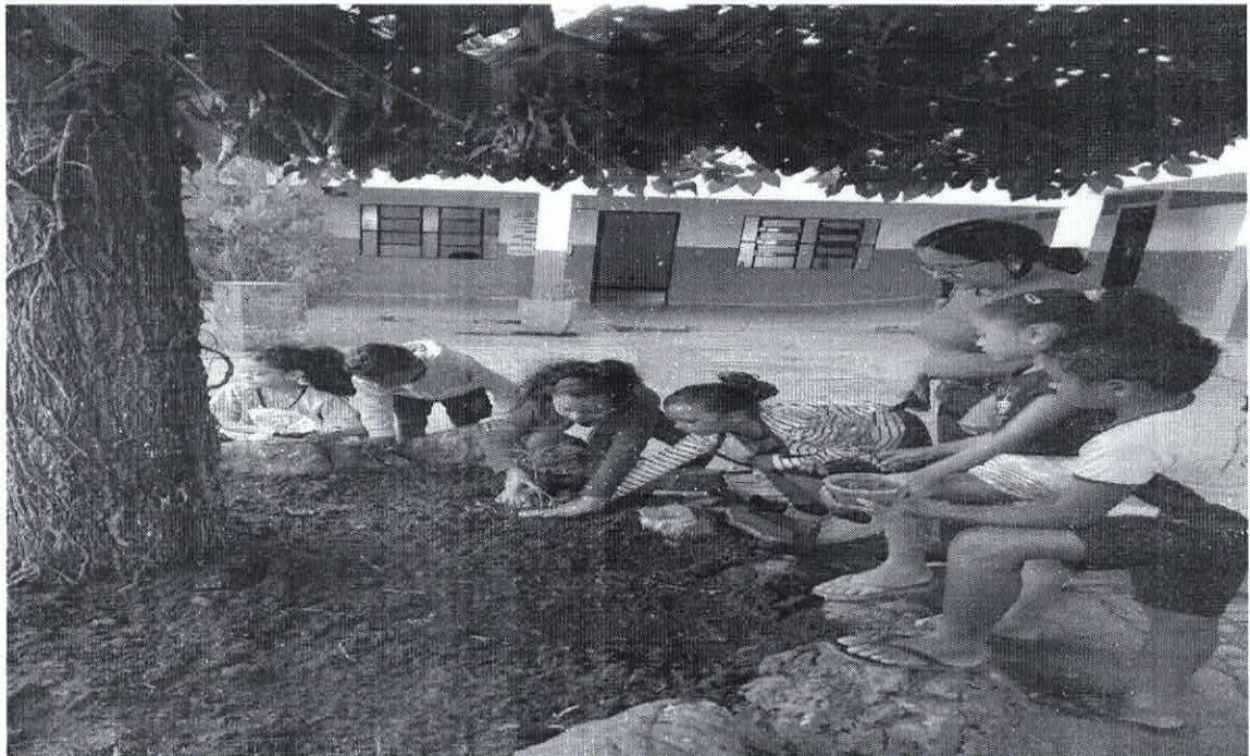
Plantio no jardim da ESCOLA – 1º ANO